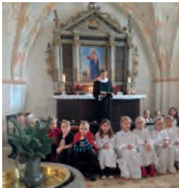
Hele flokken af minikonfirmander foran alteret og præsten.

Det kræver koncentration at gå med ægte stearinlys. De yndige piger gav os alle en fin oplevelse.