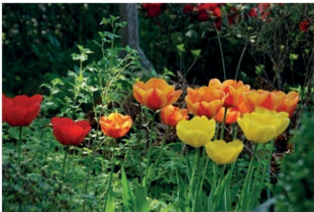
Smukke og farverige tulipaner på rad og række...