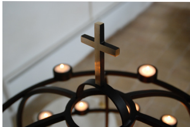
Den smukke lysglobe i Tvede kirke

Kære Gud, når mørket falder på, beder jeg om din fred over hele jorden. Lad krig og had vige, og lad kærlighed og forståelse vokse mellem mennesker. Styrk dem, der lever i frygt, og giv håb til de håbløse. Lad din fred hvile i mit hjerte og i verden. Amen.