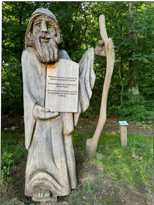
Moses byder velkommen i Kirkeskoven i Ørsted